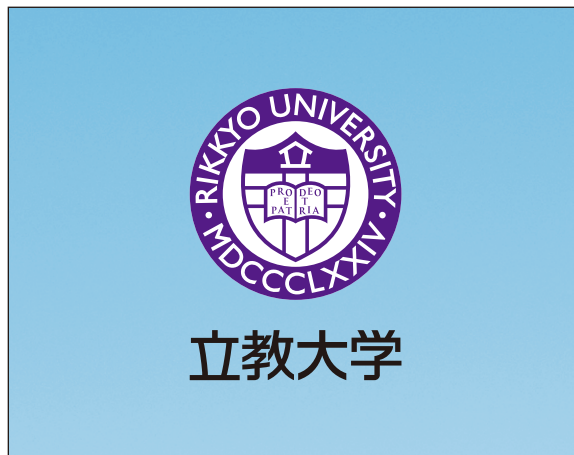
明るい背景色 (シグネチャー・システム)