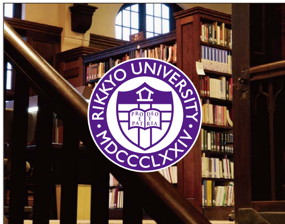
カラフルな背景色-1