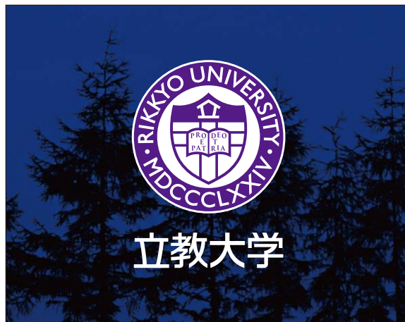
暗い背景色 (シグネチャー・システム ※校名を反転)