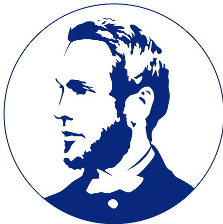
ハイコントラスト表現