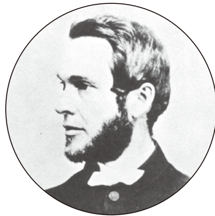
モノクロ写真表現