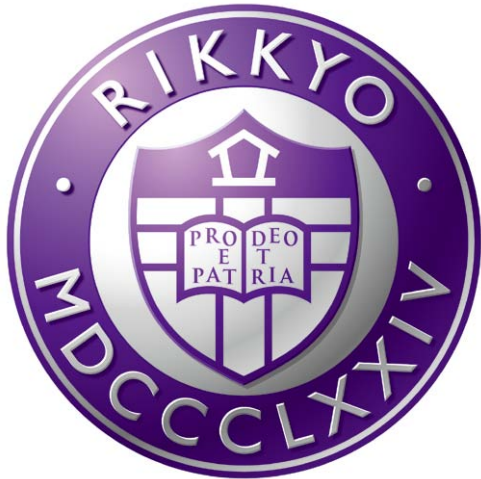
立体表現 / 立教学院