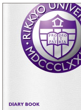
ダイアリーブック