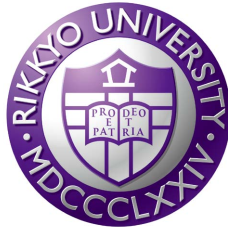
立体表現 / 立教大学